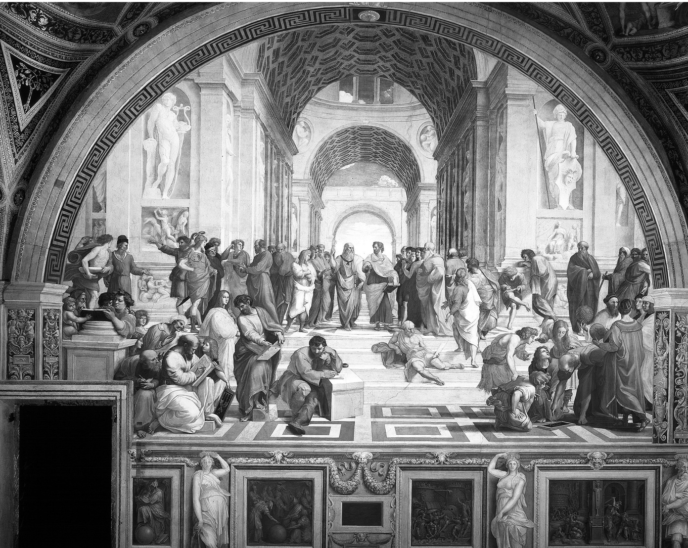
Gondolatkör – Raffaello Athéni iskola (1509–11) című freskója, amely a pápa vatikáni székhelyén, az Apostoli Palotában látható ( Wikimedia Commons )

írásait, valószínűleg még nem is sejtette, hogy „metafizika” kifejezése – amely ebben az esetben Arisztotelész természetfilozófiai írásai után következő szövegeket jelentette – ilyen jelentőségre fog szert tenni. Persze, ahogy azt az évszázadok során már többen megállapították, a metafizika „nyilvánvalóan több mint egy tartalomjegyzék félreértett tétele”. 8 A metafizika „a létezőt mint létezőt” 9 állítja elének, és a valóság egészére vonatkozóan kíván érvényes kijelentésekkel szolgálni.