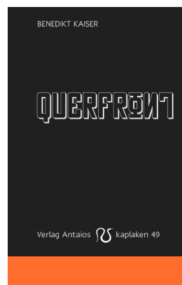
Benedikt Kaiser: Keresztfront (2017)