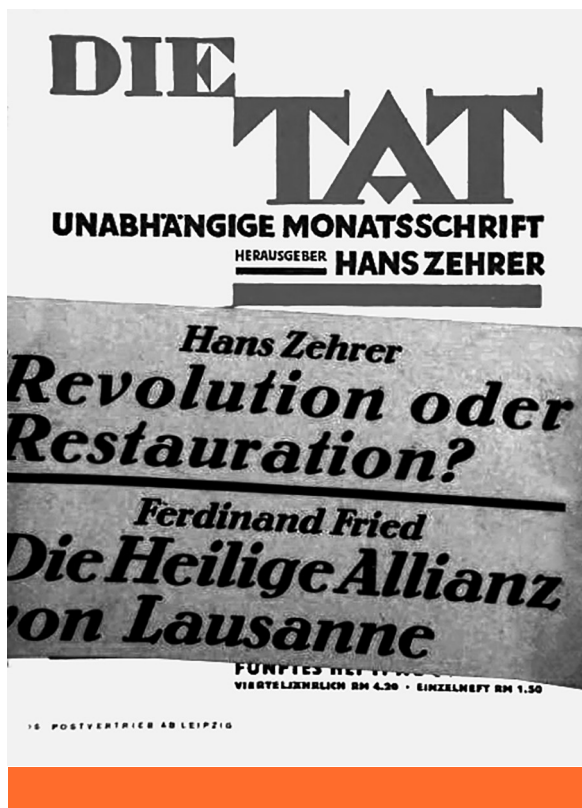
Tettek mezeje – A Die Tat 1930. júliusi és 1932. augusztusi lapszáma

voltak – vagyis egyáltalán nem tekintendők pusztán taktikázásnak és demagógiának. Természetesen Rothe, Strasser és társai számára kapóra jött, hogy különösen a Német Általános Szakszervezeti Szövetség (ADGB) politikailag megosztott volt, és hogy a munkavállalók milliói széttartónak és céltalannak látták a vezetésüket. A jobboldali tárgyalási kísérleteket az ADGB-ben különösen a fiatal káderek méltányolták. A szakszervezeti tisztségviselők és az NSDAP baloldala a nacionalizmus és a szocializmus eszméinek keverékében találkozott; a Reichswehr pedig mindenekelőtt Hitler és Thälmann együttes likvidálásában látta meg a jobb- és baloldali tömegeken alapuló összekapcsolódásának esélyét.