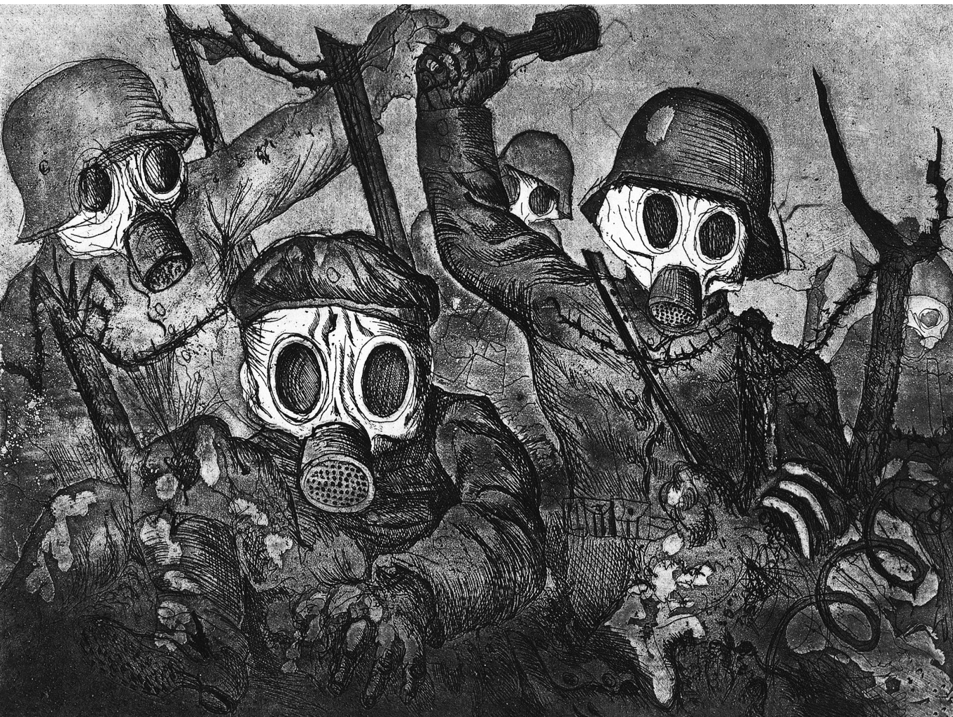
Modern maszk – Otto Dix Rohamcsapat gáztámadás közben című alkotása a Háború -ciklusból (1924) (Wikimedia Commons)

hogy racionálisan gondolkodik, mostantól viszont a tudattalan feltárása által igazán képessé válunk az emberi tudat tényleges feltérképezésére. Eddig elidegenedettek voltunk, azonban a kritikai ész alkalmazásán keresztül felszámolhatjuk az elidegenedettség állapotát. Eddig a természet vak erőinek voltunk kiszolgáltatva, ám a technológia megfelelő alkalmazása révén Új Ember alkotható meg. És így tovább, a modernitás valamennyi stációján. A nonmodern ki akar törni a modernnek kudarcos öngazoló disputáiból. Noha egymástól eltérnek a hangsúlyok, minden modern paradigmában közös az emberi önrendelkezés megteremtésének álma, a külsődlegesség humanista megvetése. Ugyan nem minden humanizmus modern, ám a modernitás lényegileg, velejéig, esszenciálisan humanista. Mindebből természetesen nem következik, hogy a modernitás kizárná a rasszizmust. Sőt, a humanizmus az emberképből kizárt Másikat mintegy szükségszerűen előfeltételezi. Legyen szó a szubhumán státuszba száműzött embercsoportokról vagy az emberi kategóriájába nem foglalható állati és növényi létezőkről. Az antropos történetileg mindig egy kizáró struktúra, egy antropológiai gép alakzatában mutatkozik meg. A modernnek egyetemessége szelektív rendszerként válogatja ki az integrálóképes elemeket.