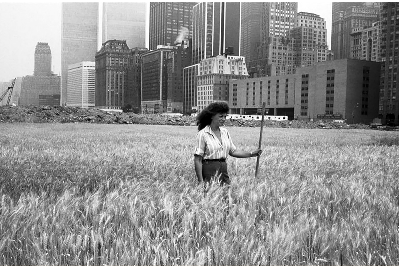
Válságálló – Agnes Denes A búzamező című land art alkotása New Yorkban (1982) (Leslie Tonkonow Artworks + Projects, John McGrall felvétele)

cselekvést”. Azáltal, hogy szakítanak a szokásokkal és rutinokkal, „további válságokat idéznek elő, és képesek a meglévő hatalmi viszonyokat megújítani vagy instabillá tenni”. 15 Ez utóbbi nem más, mint a BRD-ben működő rendszerellenzék vágya. Hiszen csak a „hatalom válságában” (Antonio Gramsci) veszítik el az uralkodó elitek a társadalmi konszenzust; vagyis immár nem vezetnek, hanem csak uralkodnak. A lakosság egy része elfordul a régitől, közte a korábbi pártoktól, a korábban fogyasztott médiakínálattól, de az új felé még nem képes nyitni. Elvesztették a bizonyosságokat és a biztosítékokat, de még nem találtak rá semmi olyanra, ami a stabilizálódást segítené. A Gramsci-féle katarzis még nem következett be, mivel a krízisrealitás, amely a fennálló viszonyokkal való elégedetlenséget hozná magával, nem szül automatikusan válságszolidaritást a nonkonformista szereplőkkel. A bizalmat ugyanis ki kell vívni, a hegemoniáért pedig meg kell küzdeni. Márpedig a válságok teremtik meg ehhez a szükség-szerű objektív kiindulópontot.