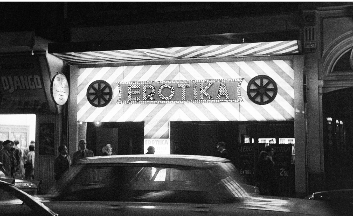
Szexuális forradalom – Párizsi éjszaka a Boulevard de Clichy, 1967

haladás egy előre kijelölt cél felé, hanem dialektikus-ellentmondásos folyamat, például abból a szempontból is, hogy az emberiség egészének gazdagodása egy bizonyos pontig az emberi egyének többségének feláldozása árán zajlik. 23 Amíg a termelőerők fejlettsége egy bizonyos szintet el nem ér, a társadalom óriási többsége kénytelen kizárólag fizikai munkával foglalkozni, hogy egy kisebbségnek legyen módja teljesen a szellemi javak gyarapításának szentelni magát. 24 A kizsákmányolás tehát elkerülhetetlen. Ez vonatkozik a rabszolgaságra is, akár feketék, akár mások ennek áldozatai. Marx így ír ennek az intézménynek az újkori formájáról: „Rabszolgáság nélkül nincs gyapot; gyapot nélkül nincs modern ipar. Csak a rabszolgáság tette értékesé a gyarmatokat; a gyarmatok teremtették meg a világkereskedelmet, s a világkereskedelem a feltétele a nagyiparnak. [...] A rabszolgáság nélkül Észak-Amerika, a leghaladottabb ország, patriarchális országgá alakulna át. Töröljétek le Észak-Amerikát a világ térképéről, és az eredmény az anarchia lesz, a kereskedelem és a modern civilizáció teljes hanyatlása. Tüntessétek el a rabszolgáságot, és letörliket Amerikát a népek térképéről.” 25