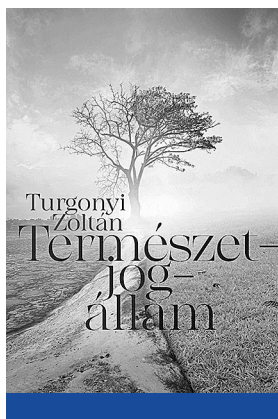
Turgonyi Zoltán: Természetjogállam (2021)

Az alábbiakban amellet szeretnék érvelni, hogy a jelenleg uralkodó nyugati korszellem, amely civilizációnkat a szakadék szélére sodorta, összhangban van a régi liberalizmus belső logikájával. A mai válság éppen abból fakad, hogy a liberalizmus a 20. században elkezdte következetesen alkalmazni és a végső-kig kiaknázni már korábban deklarált elveit. Úgy is fogalmazhatunk: addig volt működőképes, amíg nem vette komolyan önmagát. A probléma lényegét a liberális „kárelven” keresztül lehet megragadni, mely szerint az egyén bármit megtehet, amíg másoknak nem okoz kárt, vagy másképpen fogalmazva, szabadságának egyetlen korlátja más egyének hasonló szabadsága. 1 Ez azonban önmagában kevés akár az erkölcs, akár az erre épülő jogrend megalapozásához. Az erkölcsnek valójában csak az egyik funkciója az egyének megvédése attól, hogy kárt szenvedjenek el. A másik a társadalom folytonos létezésének és fejlődésének biztosítása. Ehhez pedig olyan normák is szükségesek, amelyek megszegése nem sérti egyetlen konkrét egyén érdekét sem, s amelyeket így a kárelv alapján nem lehet előírni.