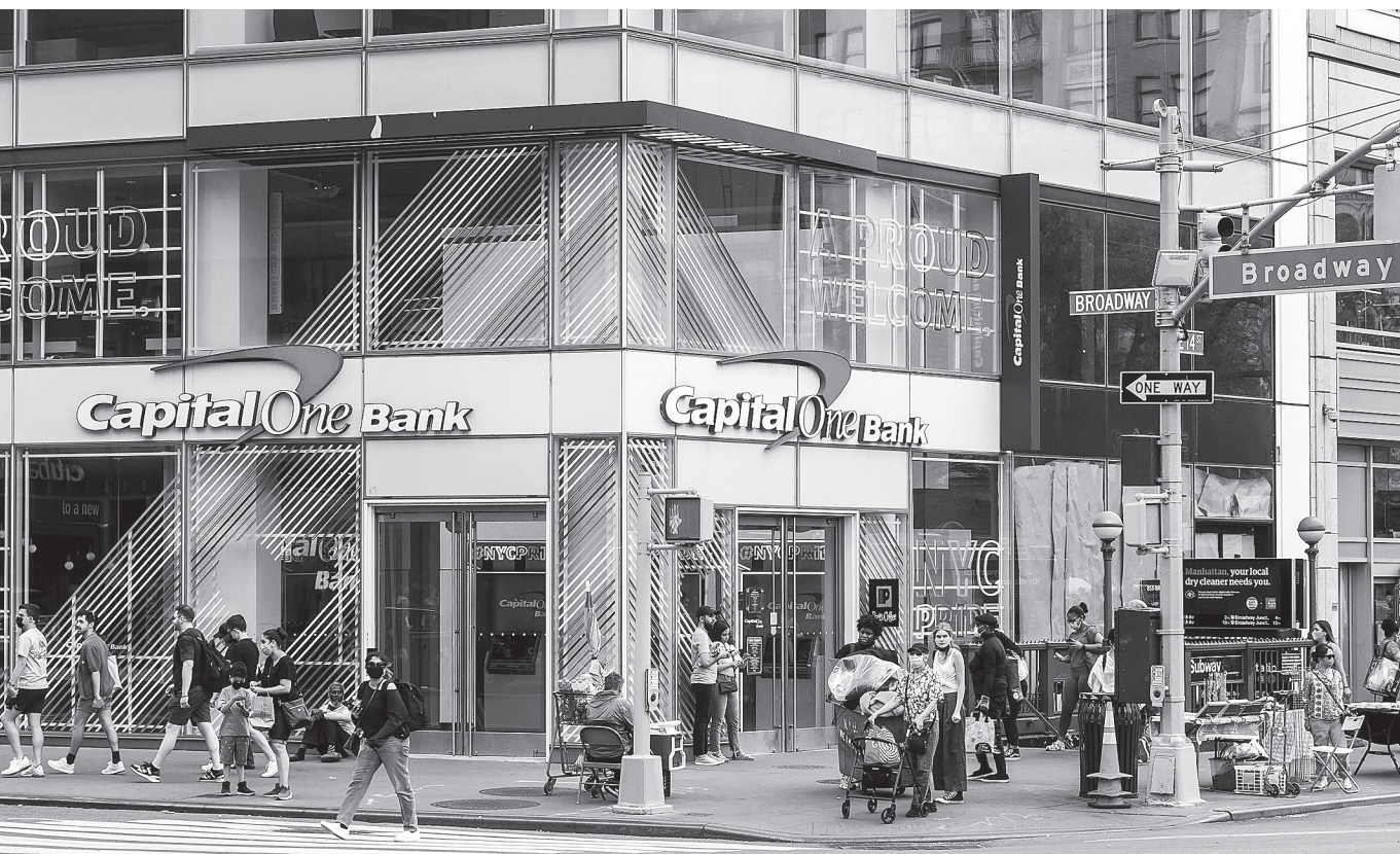
Szivárványkapitalizmus – A Pride-hónap alkalmából feldíszított LMBTQ-barát bank New Yorkban, 2023

életét fenntartsa és újratermelje”, azaz mindig fennmarad „a szükségszerűség birodalma”. 30 Ellenem veheti valaki, hogy sokféle marxizmus létezik, s hogy végső soron konvenció kérdése, milyen elnevezéssel illetünk egy-egy irányzatot, tehát ha egy szerzőnél akár egyetlen marxi gondolat felbukkan, ez már elég indok lehet arra, hogy az illetőt marxistának minősítsük. Elvileg persze ez lehetséges, de a gyakorlatban meglehetősen sok zavart és félreértést szül. Véleményem szerint van néhány olyan alapgondolat, amelynek megléte elengedhetetlen ahhoz, hogy egy irányzatot marxistának nevezhessünk. Ilyen például az objektív valóság létének és megismerhetőségének állítása [ezt a posztmodern tagadja – a Szerk. ], a feljebb többször említett „előfeltételek” jelentőségének és a történelem ellentmondásosságának belátása, az ember lényegi társadalmiságának és történetiségének, az emberi céltételezések és a tárgyasulások szerepének hangsúlyozása.