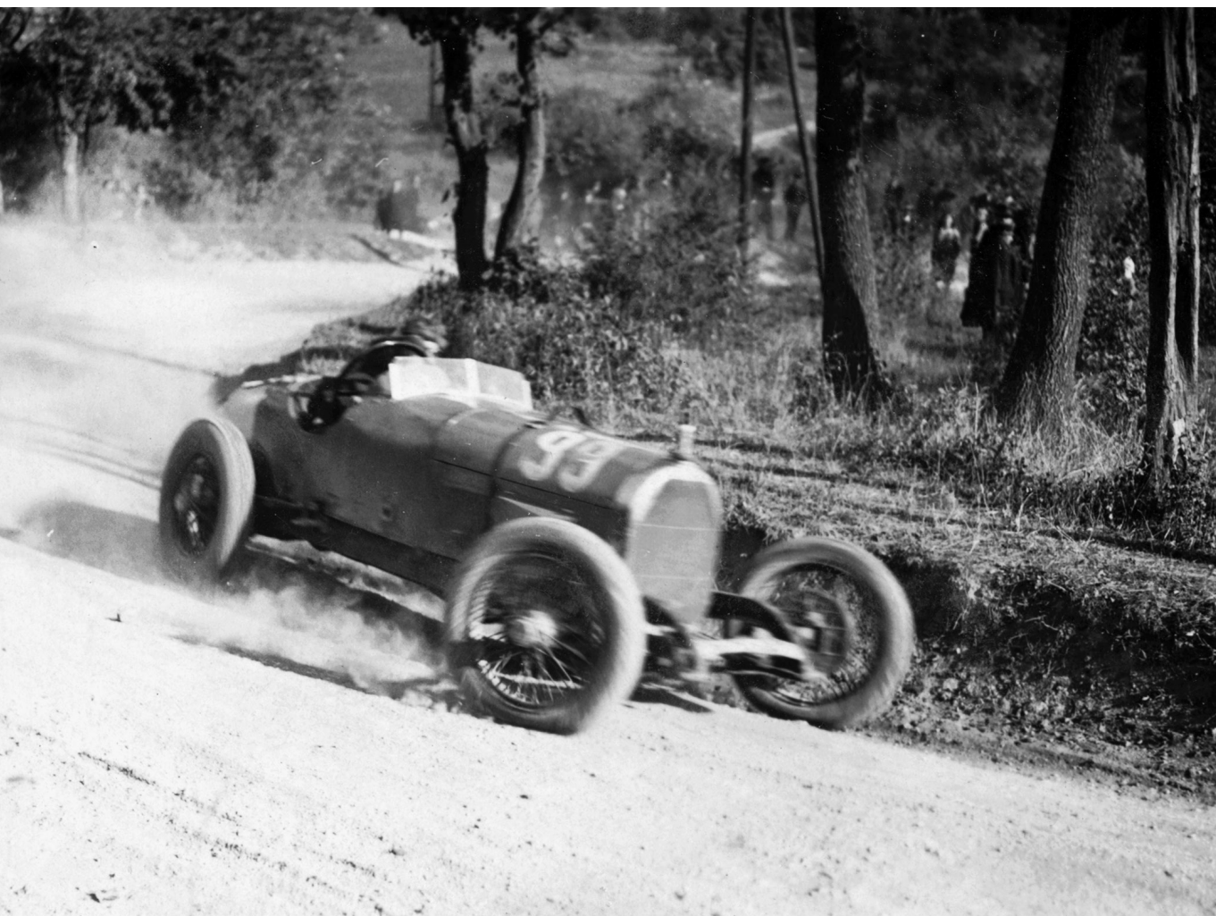
Kanyarban előzni – Autóverseny az 1928-as svábhegyi edzésen

kiszáradását okozta. A Magyar Nemzeti Bank a 2012-től induló kamatcsökkenési ciklusával és a 2013-ban bevezetett Növekedési Hitelprogrammal elérte a hitelezési fordulatot, azaz ismét elérhetővé váltak a banki források a magyar vállalatok, elsősorban a kis- és közepes vállalatok számára, ami pedig a gazdasági növekedés alapvetően szükséges feltétele volt. Emellett a kormány, az MNB és a Bankszövetség hatékonyan kezelte az előző évtizedből örökölt legsúlyosabb pénzügyi problémát a családok devizahiteleinek forintra váltásával. A monetáris politika az árstabilitás megteremtésében is eredményes volt. 2017 és 2020 között lényegében végig az MNB 3 százalékos inflációs célja körül mozgott az áremelkedések üteme, aminek köszönhetően az átlagos infláció éppen 3 százalék volt ebben az időszakban.