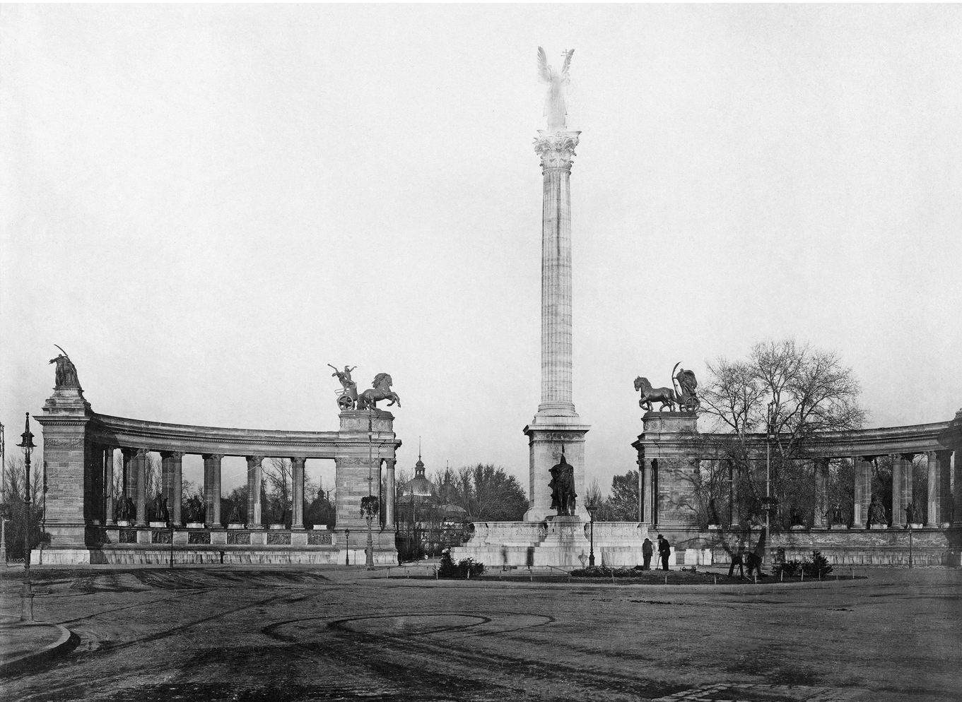
Évezred – A millenniumi emlékmű látképe a későbbi Hősök terén 1912-ben

Azt ugyanakkor komoly hátránnyá kell rögzítenünk, hogy a dualista magyar állam soknemzetiségű volt. Az 1910-es népszámlálás adatai szerint a Magyar Királyságban a lakosság 54,4 százaléka volt magyar, míg a maradék 45,6 százalékon hat nemzetiség (német, szlovák, román, ruszin, szerb és horvát) osztozott. A magyar politikai elit ezt a helyzetet a nemzetiségek jogairól szóló 1868. évi XLIV. törvénnyel kívánta megoldani, amely kimondta a következőket: