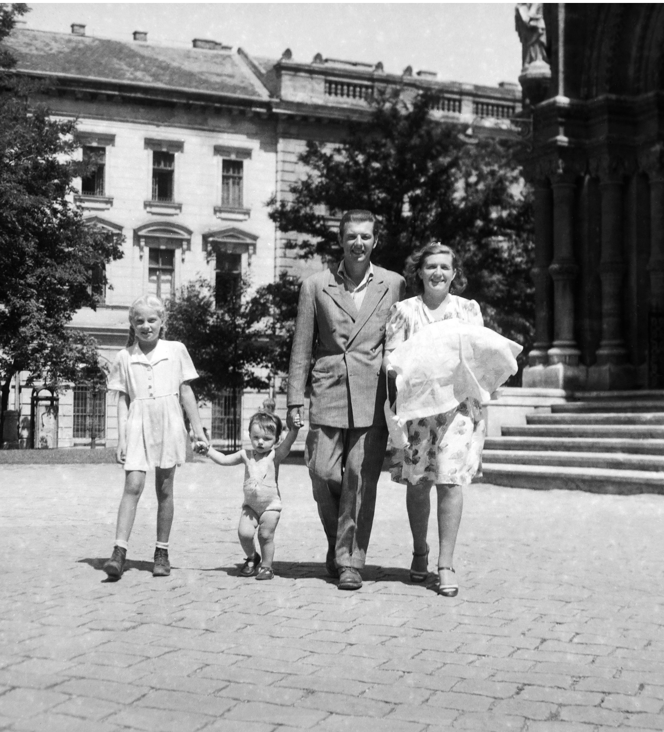
Családmodell – Család a Bakáts téri Assisi Szent Ferenc-templom előtt 1954-ben

a nemzetek halálát jelenti. Ide most az egész problémát átfogó nagyvonalú elgondolás kell, amelynek velejét megtaláljuk a családról szóló keresztény tanításban. Az a szociális dogma ez, amelyre támaszkodva a forradalmi világot kiemelhetjük sarkaiból és félelmetes halálsáncain keresztül utakat vághatunk a teremtet élet számára. Előbb azonban ennek az új rendnek tudományát kell megalkotni, ami egy szellemi vezérkar szakértő munkájára vár, mert e tudományt eddig tökéletesen elhanyagoltuk. A mi pompás magyar népünk pedig, amely még akarja a családot, a gyermeket és az erős államot, fönséges igennel fog válaszolni azoknak, akik bölcsék és bátrak lesznek erre az építő nagy harcra fölszólítani, mert első szóra meg fogja érteni benne az életfakasztó értelmet. ■