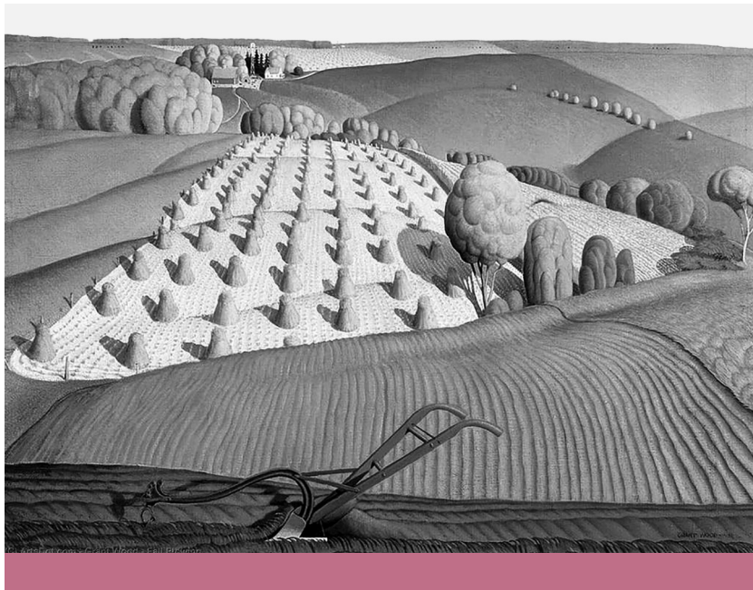
Földi jó – Grant Wood: Őszi szántás (1931)

beavatkozásaiként, hanem minduntalan érintenünk kell a halállal való szembenézés mással nem összehasonlítható egzisztenciális tapasztalatát is. Berry külön is kiemeli, hogy az egészséghez a nyugodt pihenés, a jó étkezés és a szeretet elengedhetetlen, márpedig a kórházak éppen ebben a háromban szenvednek leginkább hiányt.