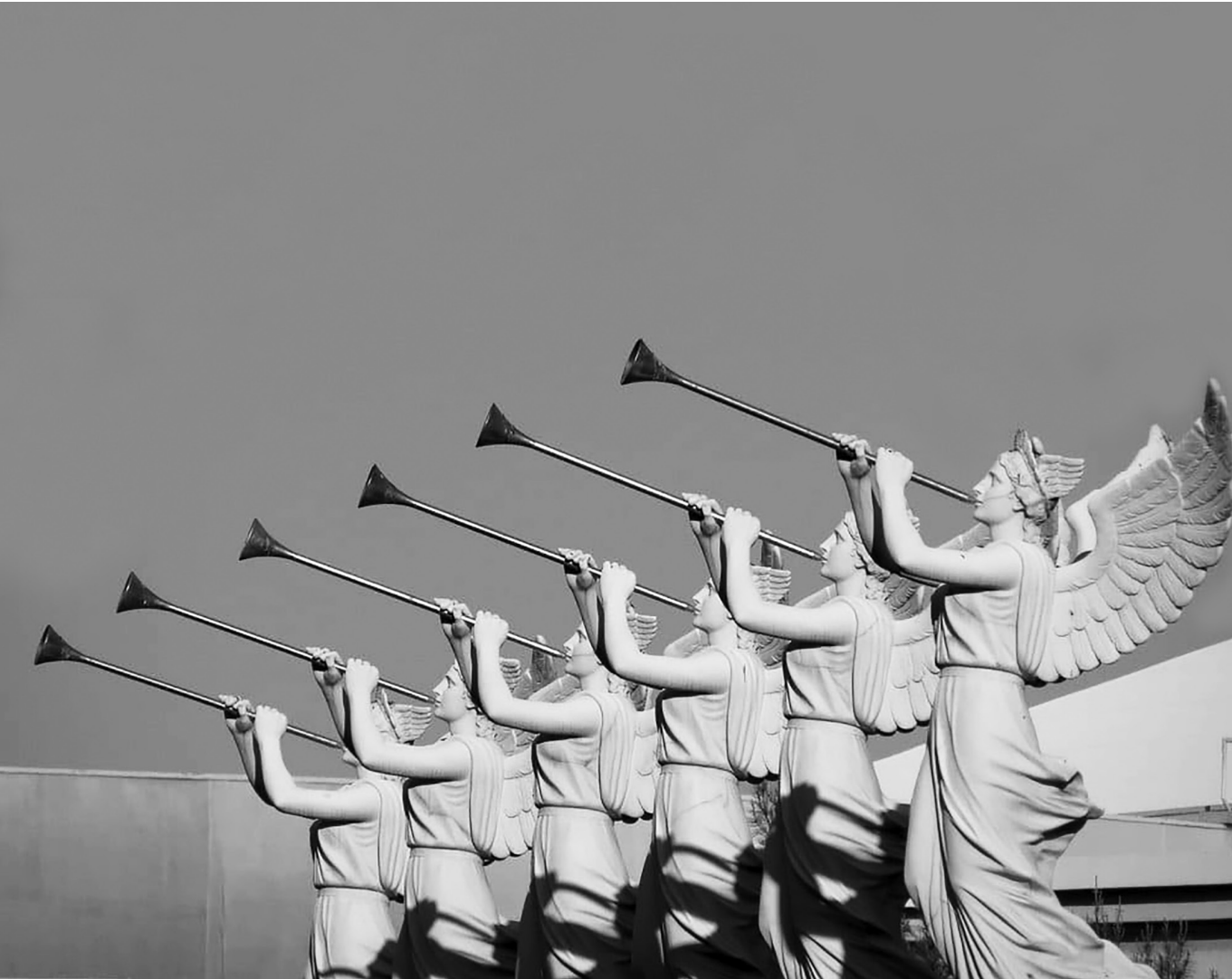
Mennyei seregek – Harsonát fúvó angyalszobrok (X)

A magát a liberalizmustól és a szocializmustól egyaránt megkülönböztető és egyenlő távolságra helyező, harmadik utas kereszténydemokrácia működőképességét – túl a fent röviden említett szellemi megalapozottságon – az európai integráció sikere, az évtizedekre megteremtett és a közelmúltig elveszítetlennek hitt béke és gazdasági jólét éppúgy igazolja, mint az európai nemzetállamokban kivívott eredményei. 6 Utóbbiak közül kimagaslik az NSZK és a kereszténydemokrata vezetése alatt elért gazdasági csoda, valamint az a megbékélés, ahogy Németországot Adenauer visszavezette az európai nemzetek közösségébe.