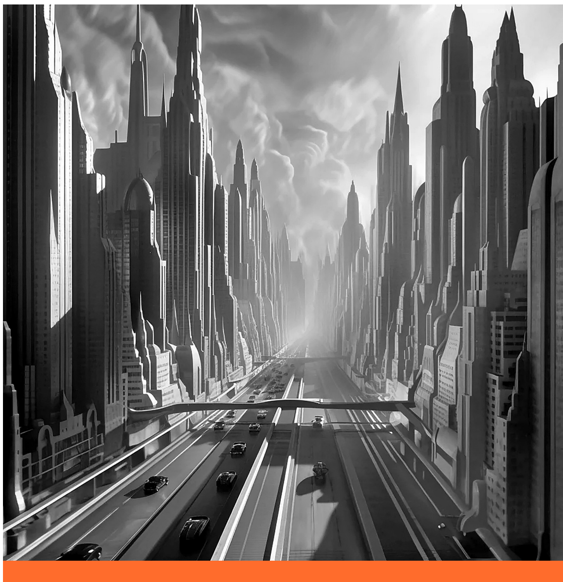
A jövő útján – A Metropolis (rend. Fritz Lang, 1927) című fekete-fehér sci-fi újraalképzelt verziója