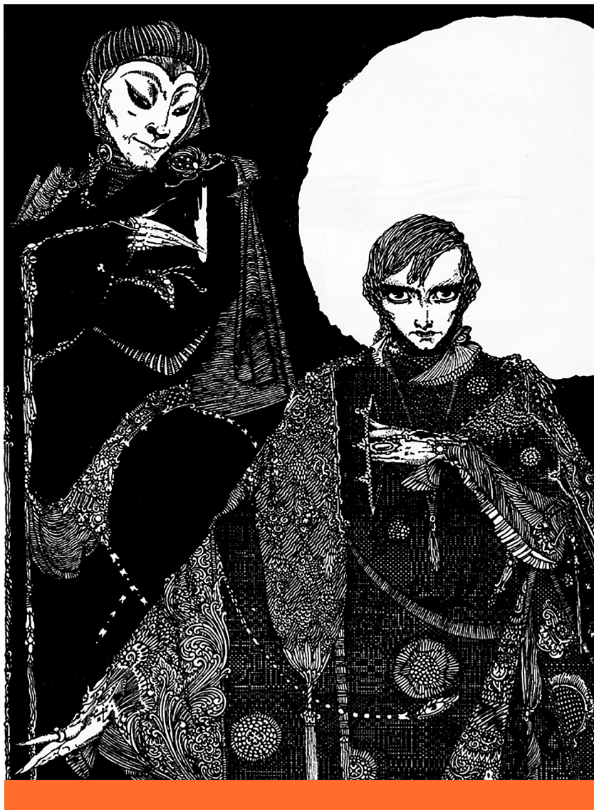
Kisértés – Harry Clarke illusztrációja Goethe Faustjának 1926-os brit kiadásához