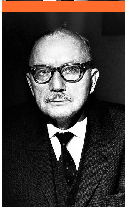
Napnyugati bölcsek – Oswald Spengler (1880–1936), Hans Freyer (1887–1969) és Arnold Gehlen (1904–1976)