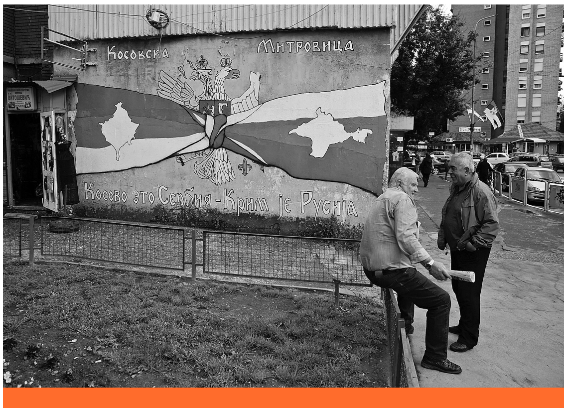
Fegyverbarátság – Az orosz–szerb szolidaritást ábrázoló falfestmény a Krím-félsziget, valamint Koszovó és Metóhia feltüntetésével Kosovska Mitrovicában

csak az Oroszországgal való stratégiai partnerséggel érhető el. Az orosz kormány és az orosz közvélemény egyértelműen azon a véleményen van, hogy Koszovó és Metóhia tartomány Szerbia elidegeníthetetlen része, és hogy Oroszország számára az is elfogadhatatlan, hogy a Szerb Köztársaság egy olyan egységes Bosznia-Hercegovinába olvadjon bele, amelyben a szerbeket muszlimok dominálják. Ez csak két olyan fontos példa a szerbek számára, amelyek egyértelmű különbséget jelentenek az orosz és a politikai Nyugat hozzáállása között. Ez azonban semmilyen módon nem jelentheti Oroszország kritikátlan idealizálását vagy az orosz álláspont moralizálását. A Nyugat hipermoralista ideológiáját nem szabad egy másik hatalom hasonló jellegű ideológiájával leküzdeni. Az Oroszországhoz való kötődést nem az érzelmi mámor vagy a romantikus szláv testvériség, hanem a józan politikai megfontolás kell hogy vezérelje. Érdekeink eléggé hasonlóak, legalábbis a Balkánon, és más geopolitikai lehetőségek egyelőre nem állnak rendelkezésre. Oroszország legalábbis egy olyan többpólusú világra törekszik, amely egy kicsit több mozgásteret hagy a kis államoknak. Ezzel párhuzamosan Szerbiának főként Magyarországgal kell jó kapcsolatot fenntartania és elmélyítenie. Orbán Viktor kitüntetése a szerb ortodox Profirije pátriárka részéről ebből a célból fontos lépést jelent.