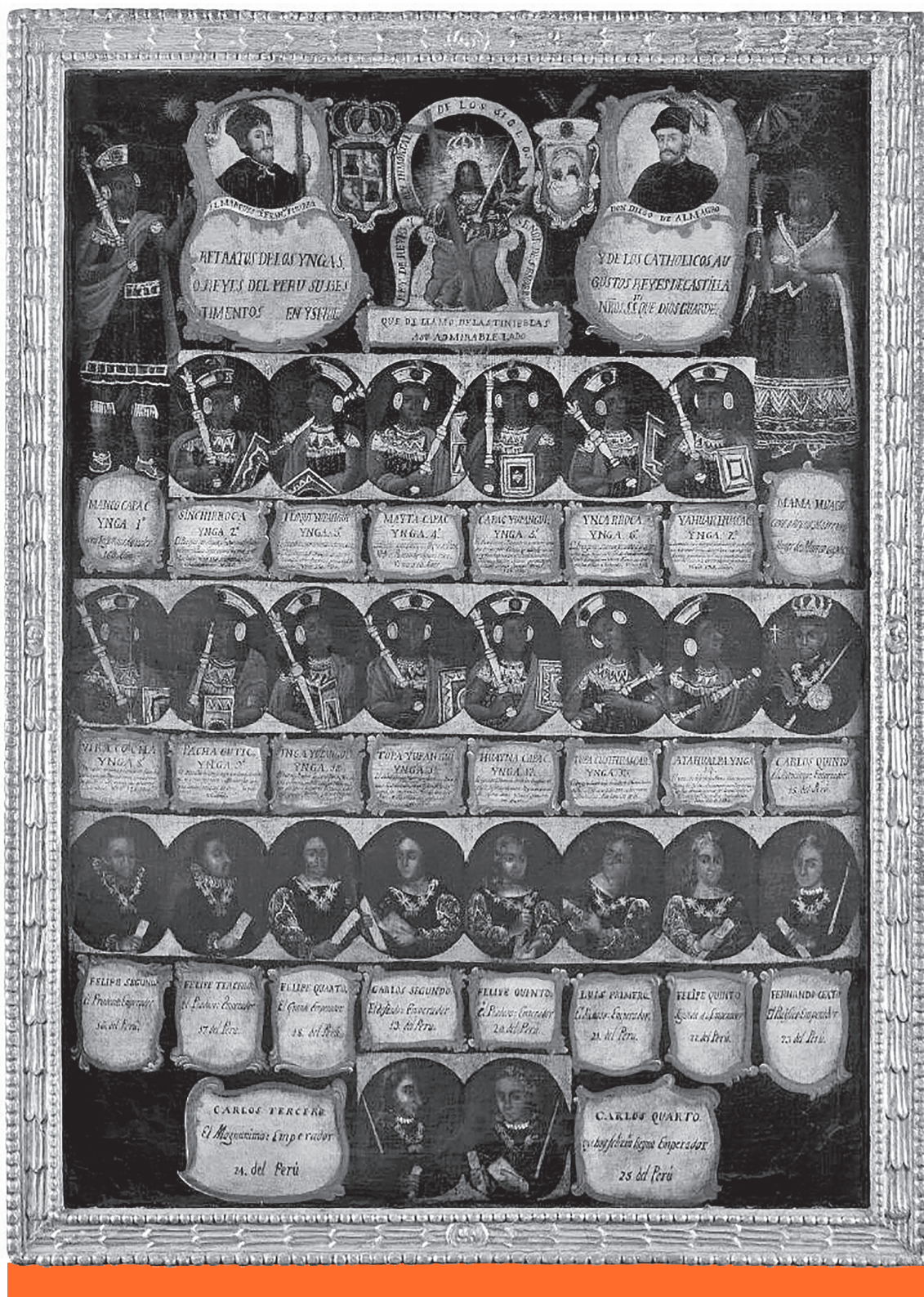
Folytonosság – Az inka uralkodók sorát ábrázoló 18. századi sorát műalkotás, a perui Limában található Museo Larcoóban ( www.museolarco.org )

háborúban és összecsapásban, de hát az erőszakot nem a spanyolok honosították meg Amerikában, a törzsi háborúkat, a kannibalizmust, az emberáldozatokat, a rabszolgaságot már ott találták. Az valahogy nem jutott eszébe a mexikói elnöknek, hogy felszólítsa az Amerikai Egyesült Államok elnökét, hogy kérjen bocsánatot azért, mert az 1840-es években – az akkora már évtizedek óta független, a spanyol koronától elszakadt – Mexikóra támadó agresszor USA megfosztotta Mexikót többek között a kaliforniai aranybányáktól és a később oly fontosra váló texasi olajlelőhelyektől. Ez persze politikai erőviszony kérdése, Porfirio Díaz mexikói elnök elhíresült mondása, „Mexikó te