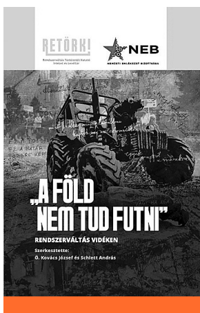
„A föld nem tud futni”. Rendszerváltás vidéken (2023)