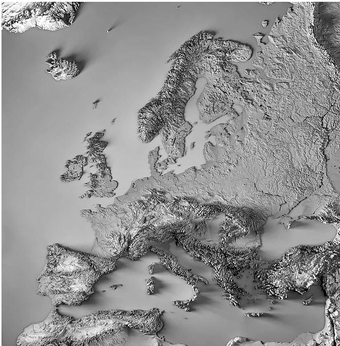
Kontinentális tér – Európa természetföldrajzi tagoltsága

épültek fel. A folyók ugyanakkor a virágzó kereskedelmet is jelentős mértékben elősegítették. A kontinensen van egy látható (de mégis láthatatlan) határvonal, ez pedig az Eurázsiai-hegységrendszer európai láncja: a Pireneusokkal, az Alpokkal, a Kárpátokkal, a Balkán-hegységgel és a Kaukázussal, amely észak–déli irányban vágja ketté a kontinenst. Minden országot valamilyen szinten determinál az elhelyezkedése, illetve földrajzi adottságegyüttese. A szerző sorra veszi Spanyolországot, Franciaországot, Görögországot, Németországot, Lengyelországot, Nagy-Britanniát. Nemzetközi kapcsolataikban, bel- és külpolitikai folyamataik alakulásában nagy szerepe volt a földrajzi tényezőknek, ami a mai napig így van. Európa példa arra is, hogy a hegyek, völgyek és folyók jelentette természetes korlátok adnak magyarázatot arra, miért gazdag a kontinens nemzetállamokban, és a történelem során miért nem alakult soha egyetlen birodalomká a kontinens.