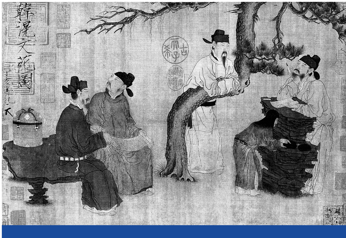
Égalatti – Csou Ven-csu Írók kertje című alkotása a 12. században (Wikimedia Commons)

ám ezzel szemben a taoista megközelítés még nagyobb teret is hagy az innovációra, mint a konfucianizmus, de kiegészíti azzal, hogy nem betonozhatja be az így kialakult munkamegosztást jogrend vagy szokás. Helyette lehetőséget kell biztosítani mindenki számára a felzárkózáshoz. Ennek köszönhetően a taoizmus olyan elemmel egészítette ki a kínai hagyományt, ami a konfucianizmusnak önmagából fakadóan nem része.