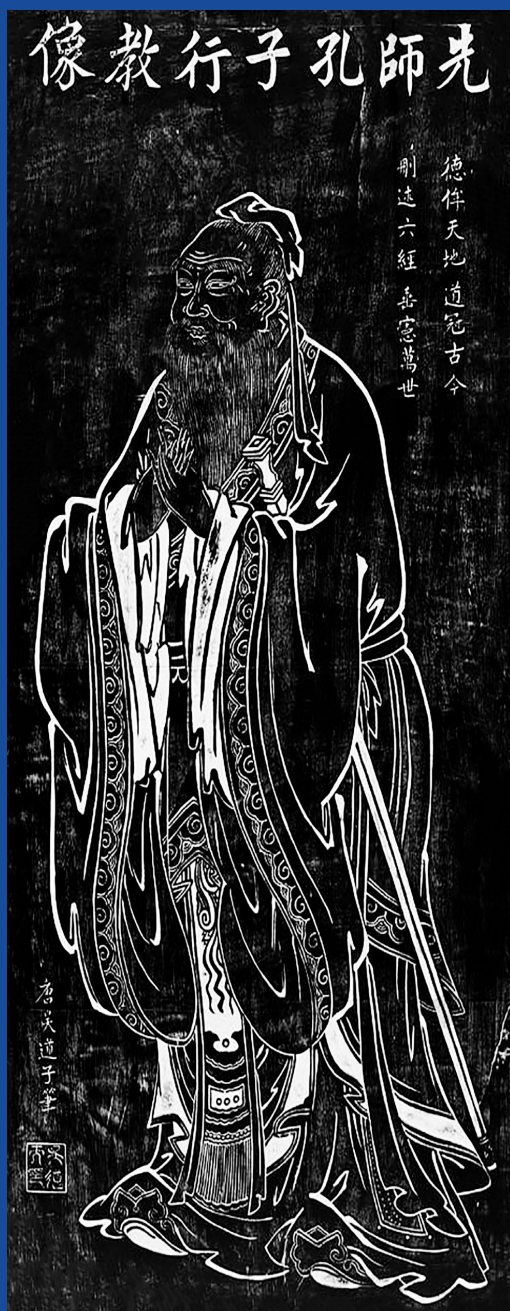
Konfuciusz (孔夫子, Kong Fūzi, Kr.e. 551–479) ábrázolása a Tang-dinasztia idején, a Kr.u. 8. században (Pycril)

Konfuciusz ideális világgépében az összetartó erő nem a joguralomból vagy a kölcsönös előnyök kiaknázásából fakadt, hanem a természetben meglévő rendből és az ahhoz való igazodásból az ősök tisztelete, a család és az uralkodó iránti odaadás mentén. A rítusok tehát fontosabbak voltak, mint a papság, a szokások nagyobb jelentőséggel bírtak, mint a bürokrácia. „A birodalmi vallásnak ennek következtében nem volt tulajdonképpeni papsága; a szakrális feladatokat legtöbbször hivatalnokok látták el, akik a rítusok miniszterének voltak alárendelve” – szól az értékelés. 7 Mivel az emberek irányításában a szertartások voltak a legfontosabb eszközök, azok lebonyolítását a kínai császár maga végezte.