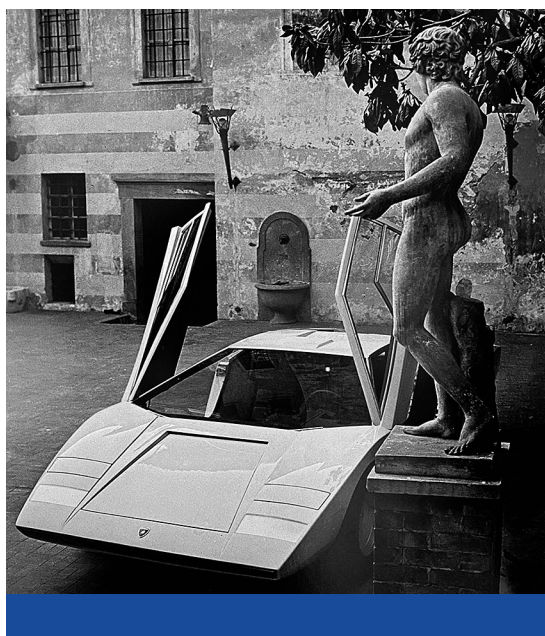
Formában – Adonisz-szobor mellé leparkolt Lamborghini Countach Bolognában, 1971 ( Volant, X )

Szabadon idézve a szerzőt, a kötet alapján hozzáállásunk nem lehet más, mint rendezettségre törekvő emberré válni, akit a szépség iránti szenvedély jellemz, az otthonteremtés vágya fűti, hisz Istenben, harmonikus együttélésre törekszik a természettel és az időtlenség ideájával szívében alkot. Olyan jól megtalált szókapcsolatokkal is leírja mindezt, mint a javítás kultúrája és a karbantartás becsülete. S hogy mi is végre a címadó mindenség algoritmus ? A következő, kerrek egész: „Az istenfélő, természettudatos, a szépséget szenvedélyesen kereső, tudását és otthonát állhatatosan építő és védelmező, megfontoltan újító élet.” Egy sor meghökkentő, vitriolos és éppen ezért találó megfogalmazást is idézhetnénk, amelyek egyikét-másikat falakra írva is el tudom – és akarom – képzelni, mint például, hogy az igencsak kárhóztatott pszichológus „terméke az »elengedés«”, pedig inkább megtartani kellene, vagy hogy „erdőben sétálni azért jó, mert ott nem találkozunk lépten-nyomon a középszerűséggel”, esetleg az, hogy „a modern kor az emberi történelem legcsúfabb időszaka”. A szerző üdítő módon jelenti ki, hogy tévedés, hogy izlésről nem érdemes vitatkozni, ezzel szemben kell, sőt csak erről szükséges, aztán, hogy „a választék nem pótolja az otthonérzést”, de az is elgondolkodható, hogy „a 21. század végére a Homo sapiens