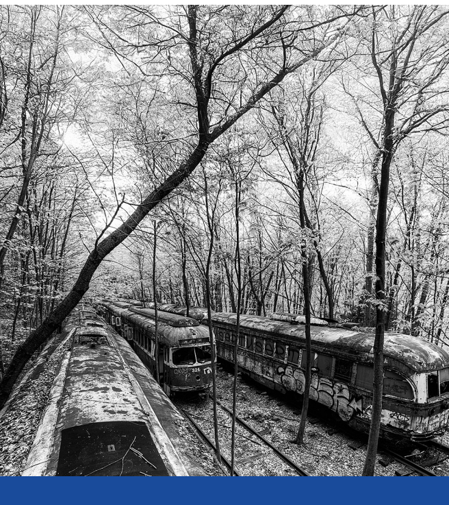
A világ végén – Elhagyott tömegközlekedési eszközök a pennsylvaniai Johnstownban, 2017

Kötter könyve egyszerre rögválóság és fantázia-világ, postreality és biodisztópia. Rendkívül izgalmas és elgondolkodtató olvasmány, amely az emberi lét mélységeit vizsgálja. A könyv középpontjában az emberi kapcsolatok, a társadalmi kontextus és a lét értelmét célzó kérdések állnak, miközben a szerző provokatív kérdéseket vet fel arról, hogy milyen világ várna ránk, ha a tudomány s vele együtt a társadalmi mérnökök vennék át a társadalom irányítását. Kötter stílusa olvasmányos és érdekesítő, gazdag képekkel fűszerezve. Az író párbeszédei élénkek és dinamikusak. A könyvben megjelenő karakterek hitelesen tükrözik a gyökerét vesztett nagyvárosi pénzelit és az ahhoz tartozni vágyók életérzését. Összességében az Élet az ember után elgondolkodtató, szórakoztató és lázadó mű, amely nemcsak a fikció és a sci-fi kedvelőinek, hanem mindazoknak ajánlott, akik nem elégszenek meg korunk érzelmekre ható, fogyasztást ösztönző egyszerű válaszaival. A könyv által felvetett kérdések relevánsak minden ember számára, aki keresi a létezés miértjét.